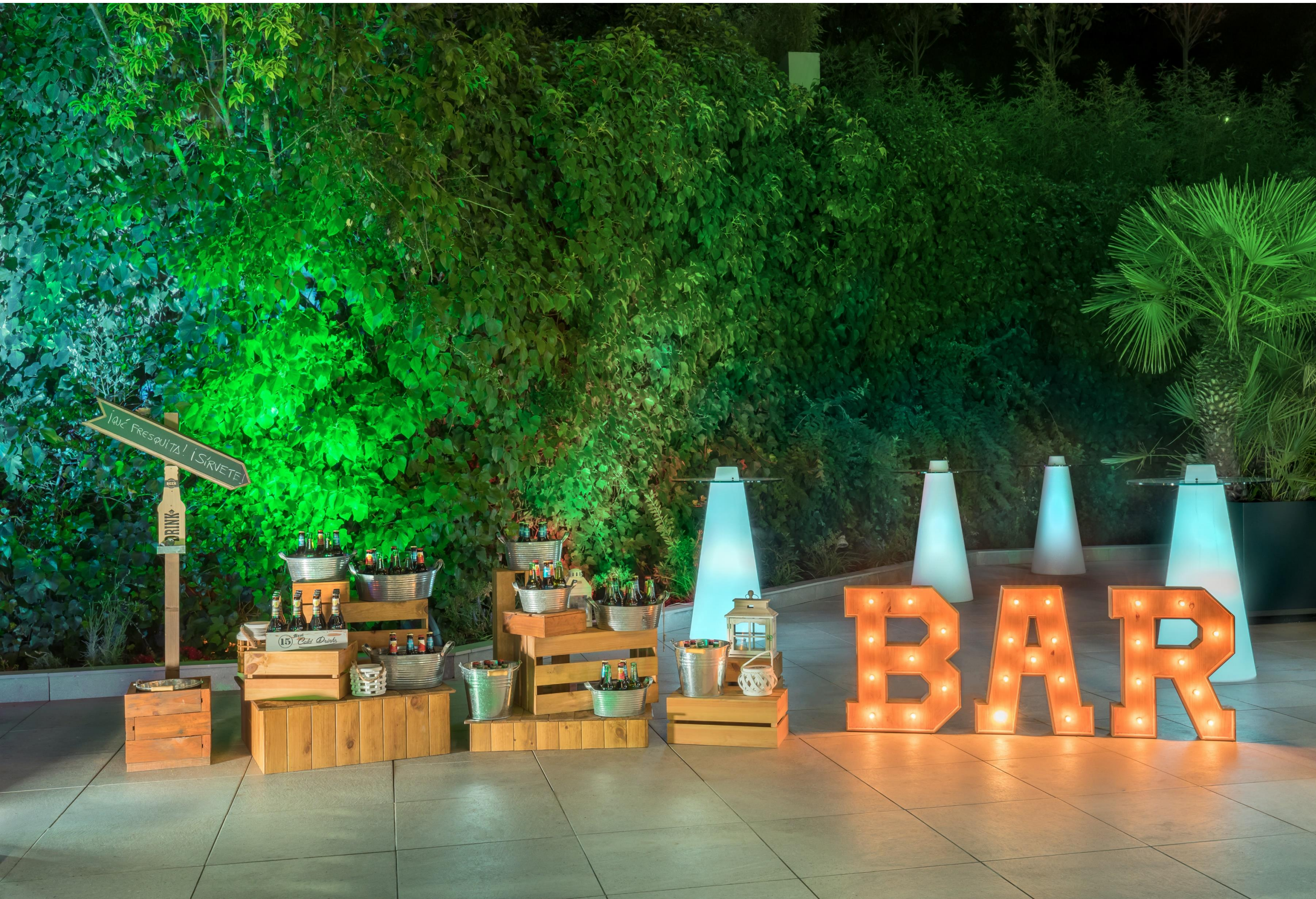
Barceló Cáceres V Centenario