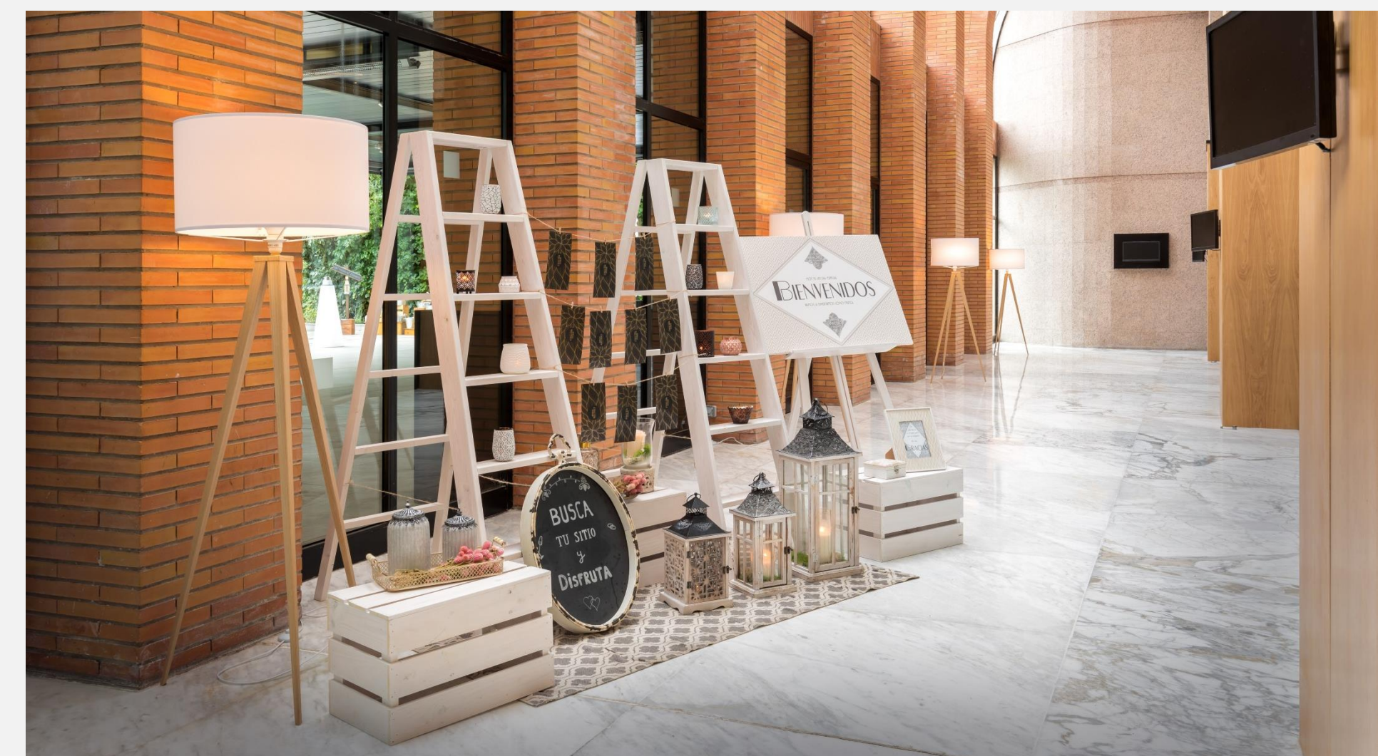
Live up to more